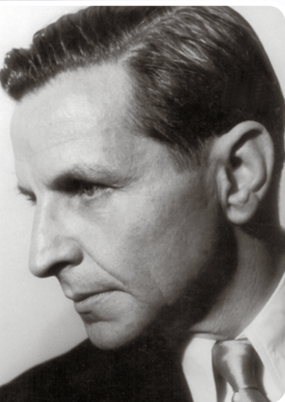
Wolfgang Langhoff (1901-1966) was een Duitse acteur en toneelregisseur.